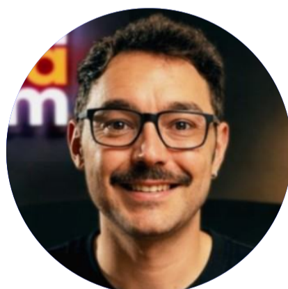
Javi Fedez Copilot Expert