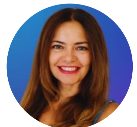
Mamen Blanco Consultora IA